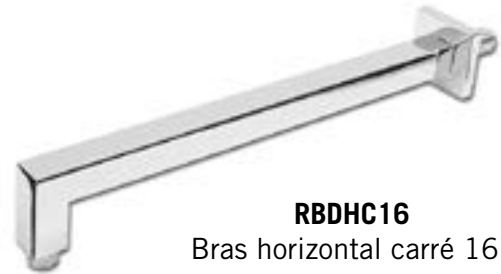
RBDHC16 Bras horizontal carré 16"