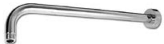
RBDHR16 Bras horizontal rond 16"